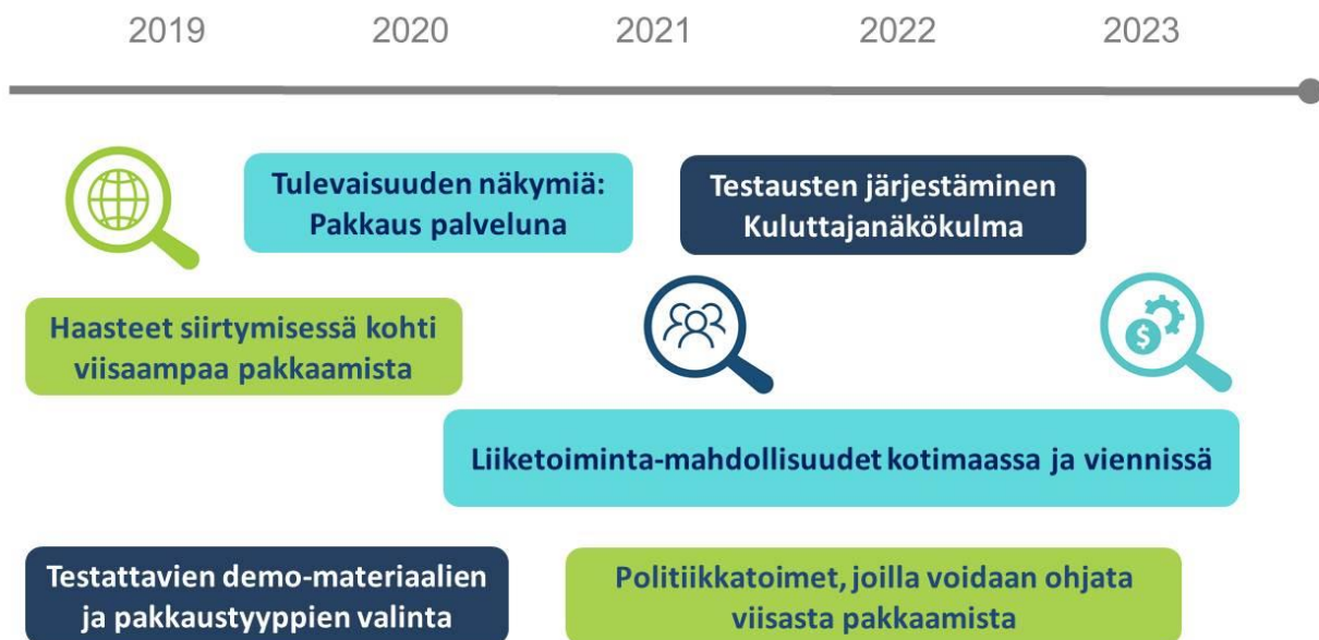
Kuva 1. Sidosryhmätapaamisten teemat ja ajoitus.

Suomalainen tutkimus- ja kehitystoiminta on edelläkävijä erilaisten innovatiivisten selluloosapohjaisten materiaaliratkaisujen tuottamisessa. Niiden kaupallistaminen on kuitenkin osoittautunut haastavaksi, sillä se edellyttää muutoksia sekä kysynnän että tarjonnan puolella. Selluloosapohjaisia materiaaleja on kehitetty korvaamaan fossiilipohjaisia muoveja myös pakkaamisessa. Package-Heroes tarkastelee ruoan pakkaamisen, jakelun ja kulutuksen muutoksia sekä liiketoimintaekosysteemejä, jotka syntyvät muuttuvan pakkaus- ja ruokateollisuuden ympärille. Päämäärämme on etsiä pakkausratkaisuja ihmisen, maapallon ja liiketoiminnan hyväksi. Muutokset eivät tapahdu itsekseen, vaan niiden tueksi tarvitaan suotuisa kasvualusta. Tällainen voidaan luoda kansalaisten, yritysten ja poliittisten päättäjien yhteistyöllä. Päätöksenteon pohjaksi tarvitsemme tutkittua tietoa. Sen pohjalta tunnistamme kansallisia toimia vauhdittamaan maailmanlaajuisesti kilpailukykyisten liiketoimintaekosysteemien muodostumista.